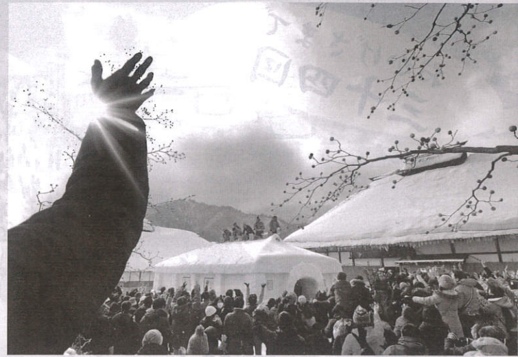
前回の金賞作品 「イベントに輝き」 矢作 武一様